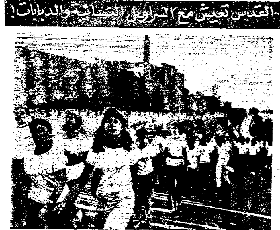
القدس كالتصوير مع السراويل... (Caption describing the photo above)

عمان - ١١ - قام سمو الامير الحسين بن طلال الملك المعظم بزيارة كريمة قصر امس لجنى التلفزيون حيث تفحص العمل في مشروع التلفزيون العربي قبل افتتاحه الرسمي بعد ايام - وكان البقية على الصفحة السادسة عمود ٦